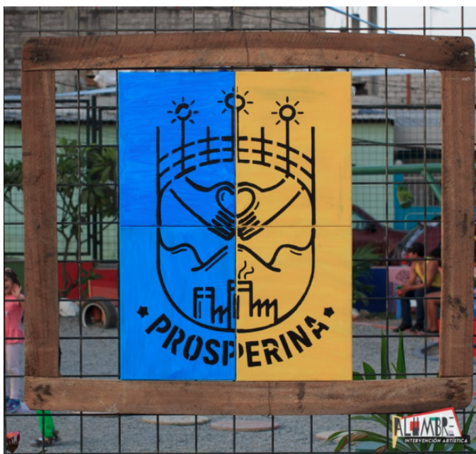
(Logo de la Prosperina creado por alumnos del taller de Serigrafía)