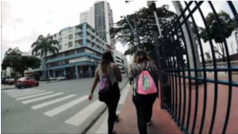
(Investigación sobre zonas vulnerables en el Municipio de Guayaquil)