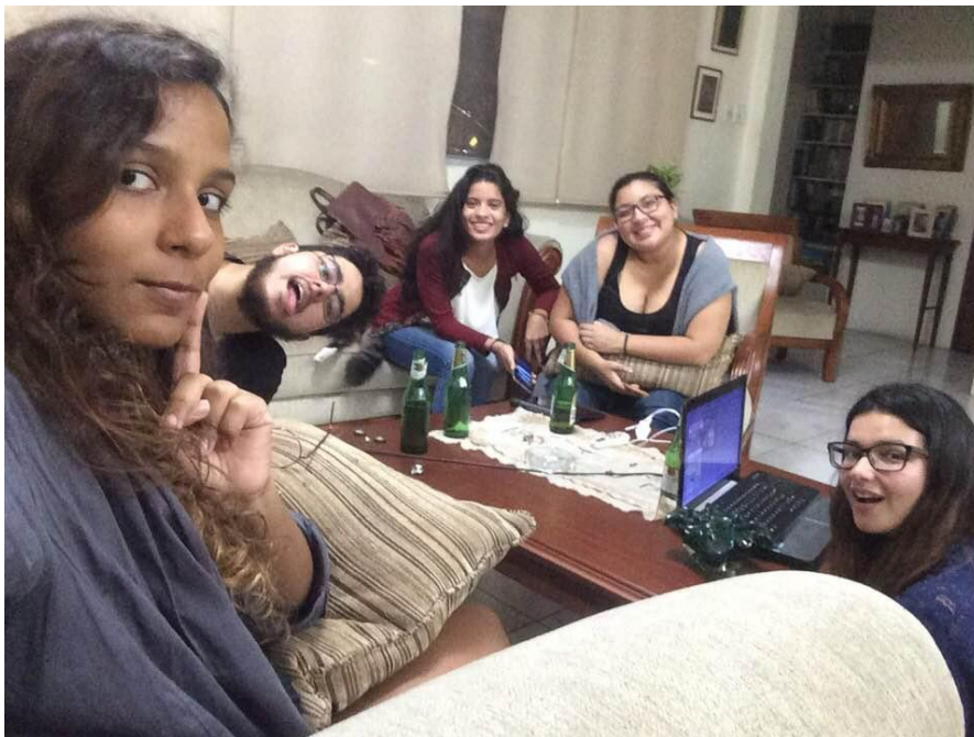
(Primera reunión de Grupo)