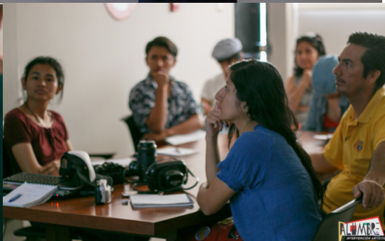
(Taller de Fotografía dictado por André Coloma)